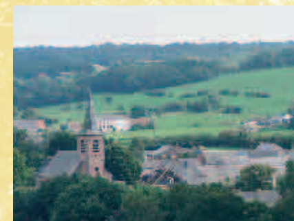
L'église de Grandrieu - De kerk van Grandrieu