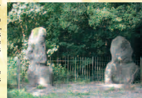
La Pierre qui tourne - De « Pierre qui tourne »

Fiches réalisées par l'Office du Tourisme de Sivry-Rance en collaboration avec la Maison du Tourisme de la Botte du Hainaut et la ville de Sivry-Rance dans le cadre du programme transfrontalier de développement touristique Interreg III, cofinancées par le FEDER, avec le soutien du Ministère de la Région Wallonne et du Commissariat Général au Tourisme.