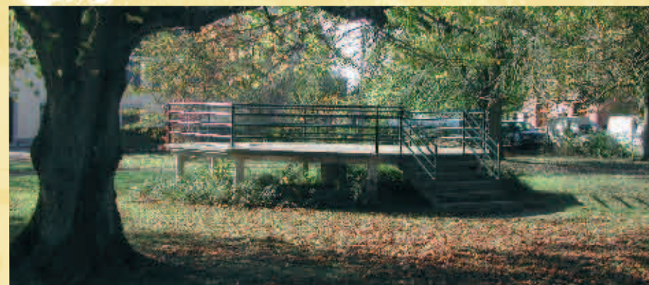
Le kiosque à musique - de musiektent

Sautin est presque le point central de l'entité, son nom proviendrait du latin « Salictinus » (petite saulée) ou « Saltus » (bois herbeux). Plus jeune village de l'entité mais aussi du canton de Beaumont. Avant le 1 er janvier 1914, il était un hameau de Sivry. Le besogné de 1608 précise que le hameau de Sautin fait partie intégrante de Sivry, mais une description à part prouve qu'il a une communauté de vie bien distincte de la paroisse mère. Dès 1834, une poignée de personnes réclament l'autonomie communale du hameau. En 1858, «le comité séparatiste» s'allie avec les hameaux de Vieux Sart, Blagnies, les Culots, les Voies de Renlies. Après maintes actions, revendications et formalités administratives, Sautin devient indépendant le 10 avril 1914 jusqu'en janvier 1977 lors de la fusion des 5 communes et d'un hameau, le hameau de la Gare de Sivry (commune de Solre-St-Géry), Montbliart, Sivry, Grandrieu et Rance. Sa superficie est de 644 hectares dont environ 200 hectares indivis avec Sautin.