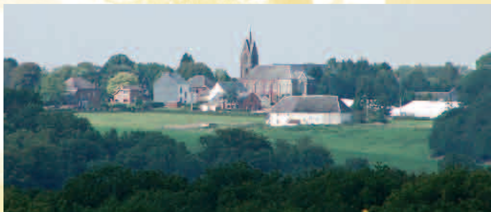
Panorama - Panorama