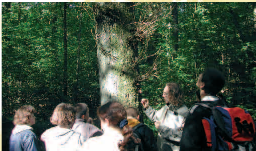
Bois de Bruyère - Bos van Bruyère

Animatoren en gidsen van L'Espace Nature van de Laars van Henegouwen organiseren er verschillende pedagogische activiteiten, zoals studie en observatie van het ecosysteem, flora en fauna, nestkastjes en verder alles wat het natuurlijk erfgoed aanbelangt.