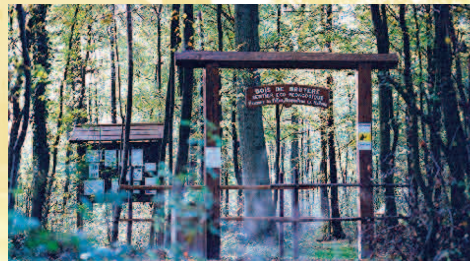
Bois de Bruyère - Bos van Bruyère

L'Espace Nature de la Botte du Hainaut y donne, par le biais de ses animateurs et guides, quantité d'animations pédagogiques comme : l'étude et l'observation de l'écosystème forestier, la faune et la flore, les nichoirs et tout ce qui concerne le patrimoine naturel.