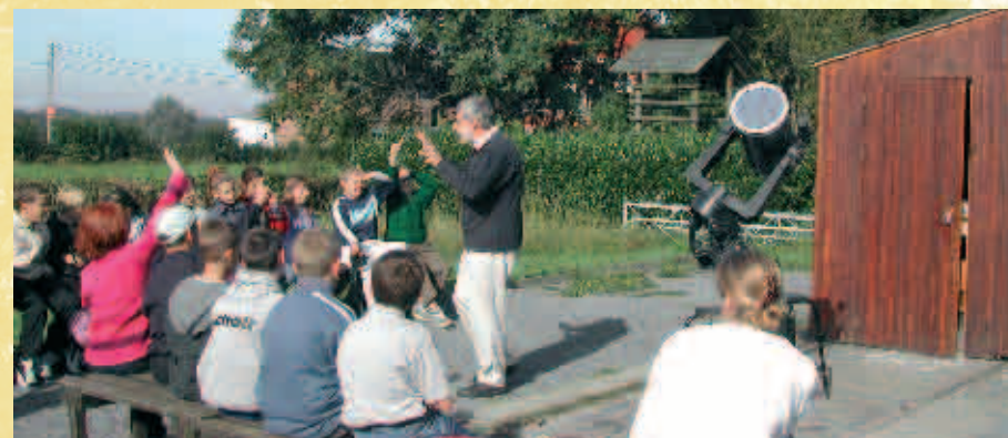
Centre d'étude de la nature et de plein air : CPDA « Recreatie-en openluchtcentrum »

1 : Le quartier de la Gare de Sivry, ainsi qu'une partie du hameau du «Lorroir» faisait partie de la commune de Solre-St-Géry. L'ensemble du Lorroir, territoire assez étendu, jouissait d'une certaine autonomie et vers la fin du 19 e siècle, il désignait ses propres membres au conseil communal de Solre-St-Géry. En 1976, lors de la fusion des communes, ce hameau de Solre-St-Géry est intégré à Sivry-Rance. Il était d'ailleurs beaucoup plus proche du village de Sivry que de Beaumont. Les bâtiments de l'ancienne gare abritent aujourd'hui le centre de dépaysement et de plein air (C.D.P.A) qui dépend de la Communauté Française. On y donne des cours de géographie, astronomie, climatologie, etc., aux groupes scolaires.