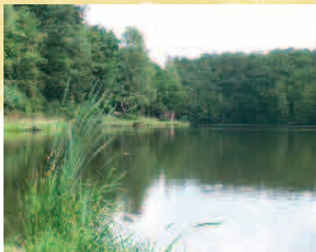
Les étangs communaux de Rance - Gemeentelijke vijvers van Rance

3. De calvarieberg van Rance werd opgericht in 1819 en gerestaureerd in 2003. Het houten Christusbeeld zou gebeeldhouwd zijn tijdens de Franse Revolutie van 1789. Het werd erg beschadigd en in 2004 gerestaureerd door het gemeentepersoneel.