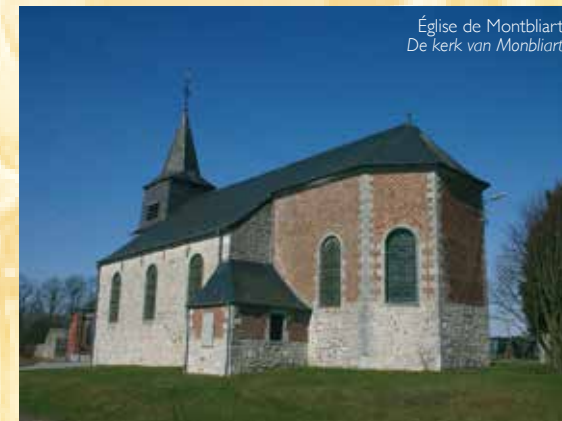
Église de Montbliart De kerk van Montbliart

5. La Chapelle , édifée en 1681, est en pierre bleue locale. Sa niche est en marbre de Rance. Elle a été restaurée en 1992 par les élèves de l'Institut Technique de Rance.