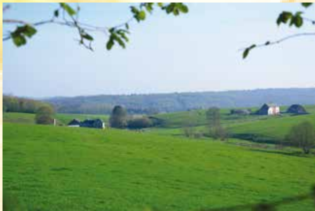
Ferme de l'Ermitage

Aan de Chemin des 15 Pieds, slaat u rechtsaf om terug te keren naar uw vertrekpunt.