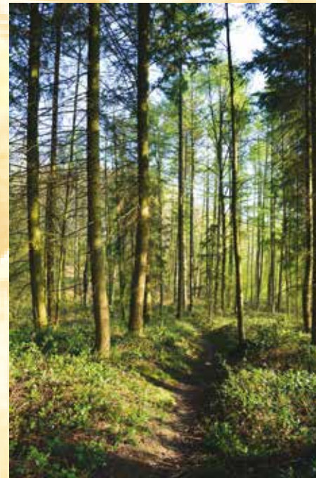
Plantation de mélèzes et douglas

Remontez ensuite vers le Chemin des Quinze Pieds. Avant d'atteindre celui-ci vous pouvez voir sur votre droite le pavillon de chasse. Sur votre gauche, un peu avant celui-ci, vous pourrez admirer 2 séquoias.