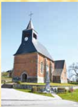
Eglise d'Eppe-Sauvage (France)

7: U komt aan het ' Bois de Bruyère ' in Sautin. Hier vindt de bezoeker een arboretum en een eco-pedagogisch parcours, dat de rijkdom van de lokale flora en fauna belicht. De kleine voorzieningen laten een halte of een picknick toe.