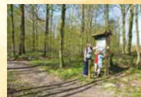
Sentier didactique du Bois de Bruyère

Retour ensuite vers la Belgique en traversant le Bois de Vieux Sart.