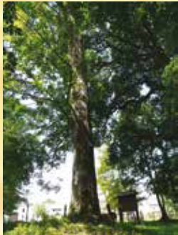
Arbre de la jeunesse à Sautin

Vertrek in het centrum van Sautin (Zie ook wandelingen 7 en 24). De geschiedenis van de inwoners van Sautin is deze van een bevolking van houthakkers en landbouwers die in de 19e eeuw de achteruitgang meemaakten van de houtindustrie, te wijten aan het verdwijnen van de ijzermelterijen in de streek. Ook de landbouw stelde steeds minder mensen tewerk. Het dorp kende een plattelandsexodus: van de 504 inwoners in 1920 bleven er nog 405 in 1971. Maar het dorp viert nog steeds het feest van de houthakkers tijdens het 2e weekend van september. In 2015 zal de 25e editie het accent leggen op de beroepen rond hout.