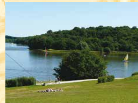
Station touristique du Valljoly

3: Vous longerez durant quelques instants le Lac du Valljoly . Ce dernier est situé dans la vallée de l'Helpe Majeure à 175 m d'altitude par rapport au niveau de la mer, dans le département du Nord en France. La forme sinueuse de ses 19 km de berges est donnée par la configuration de la vallée. Avec ses environ 3500 m de long pour une largeur d'environ 250 mètres en son centre, c'est le plus grand lac de la région Nord-Pas-de-Calais, et le plus grand en France directement au nord de Paris. Depuis 2008, le parc départemental du Valljoly est devenu une station touristique.