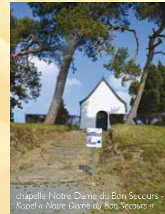
chapelle Notre Dame du Bon Secours - Kapel « Notre Dame du Bon Secours »

8. La Salle des Fêtes fut construite en 1930 à l'emplacement d'une vieille grange. La Place de la Margeride quant à elle, fut inaugurée en 1999 lors des festivités de jumelage entre notre Grandrieu Belge et Grandrieu en Lozère (France). Au fond de cette place, on distingue le presbytère, construit dans la seconde moitié du 18e siècle, avec des matériaux provenant exclusivement du village. Les pierres proviennent des carrières « du Roc » et la chaux du four sis au même endroit. Les briques ont été fabriquées avec de l'argile extraite des prairies face à la Ferme de la Cour. Le bois de charpente, provient du bois de la Plagne et le sable, des sablières de Grandrieu.