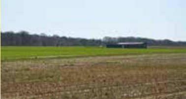
Terrain d'Aéromodélisme au lieu-dit Belle-Vue - Terrain van vliegtuigmodelbouw bij « Belle-Vue »

6. Het terrein van de 'Association d'Aéromodélisme du Sud Hainaut' werd in 1972 aangelegd. Het is de verzamelplaats voor alle fanaten van vliegtuigmodelbouw. Op dit horizontale akkerland ontdekt men het landschap van Grandrieu.