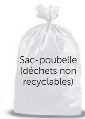
Sac-poubelle (déchets non recyclables)